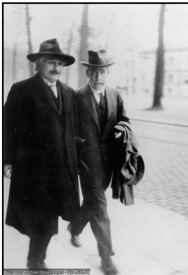
Albert Einstein og Niels Bohr