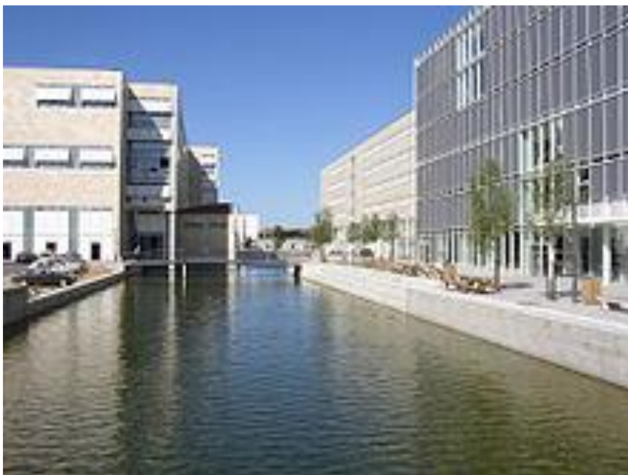
Emil Holms Kanal, Søndre Campus, København Universitet