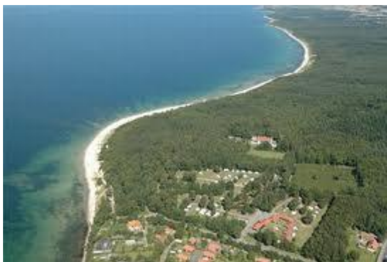
Nordskoven mod fjorden

Årsprogrammet 2016-17 blev trykt i 1.500 eksemplarer hos Printgalleriet, som i øvrigt er flyttet fra Slangstrup, og udsendt i august 2016 til alle de deltagere, som vi har i vor adressedatabase, svarende til godt 750. Som tidligere år fordelte komiteens medlemmer med henblik på portobesparelse et antal af programmerne mellem sig til uddeling i deres respektive nærmere opland. Der uddeltes på denne måde til omkring halvdelen af vore kontaktpersoner. Programmet er endvidere sendt til egnens biblioteker og i årets løb til alle, som har ønsket det.