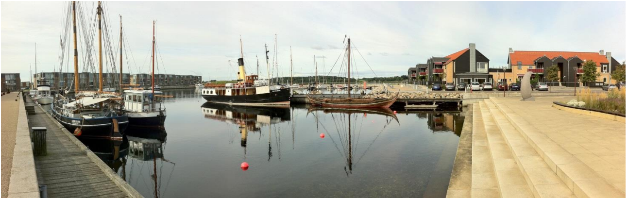
Frederikssund havn med dampskibet Skjelskør og Sif Ege