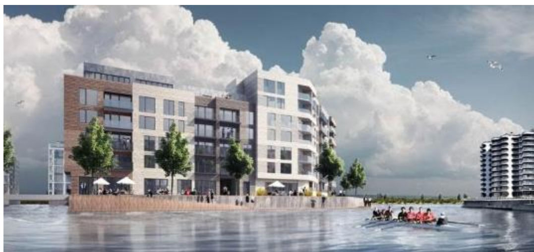
Københavns Havn - sydhavnen

Arrangementet blev en stor succes. Alle 300 pladser blev meget hurtig reserveret, og mange forsøgte forgæves at sikre sig en billet til foredraget.