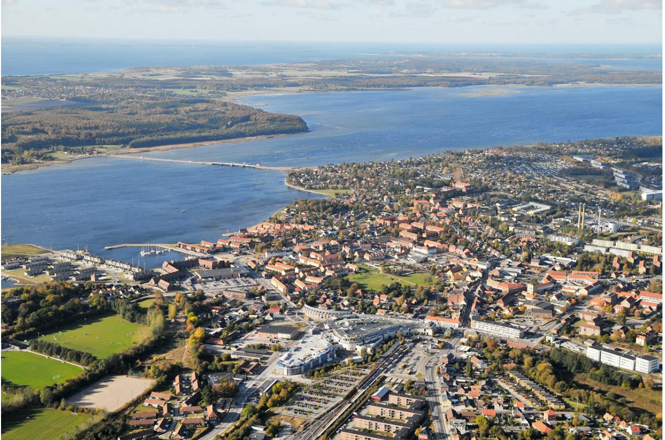
Frederikssund med Roskilde Fjord og Horns Herred