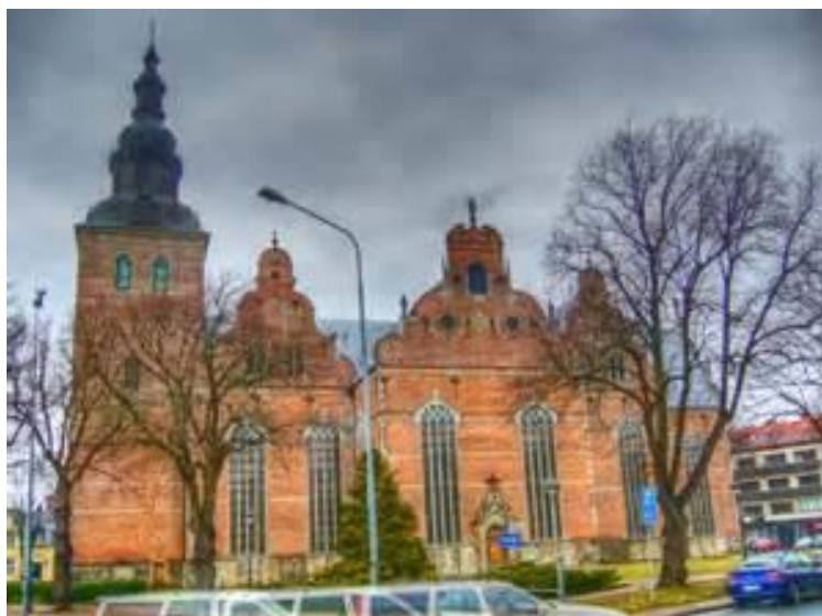
Trefoldighed kirken i Kristianstad